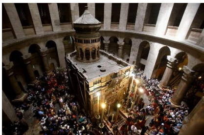
Božji grob v baziliki Božjega groba

Kmalu so obhajali ta praznik tudi v Carigradu. V Rimu ga je uvedel v 7. stoletju papež Gregor Veliki. Praznik nas spodbuja, naj z živo vero častimo podobo križa, veliko znamenje krščanstva. Na križu je trpel sam Božji Sin Jezus Kristus. Na njem je umrl On, ki ga je Bog dal za nas vse, ki je vstal od mrtvih in sedaj pri Očetu prosi za nas. Praznik nas spominja, da je Božja Ljubezen tako velika in močna, da je izničila lastnega Sina, da bi bili mi odrešeni. To nas vodi do spoznanja, da je ljubezen vedno, združena z žrtvijo. Ljubezni je lastno, da se žrtvuje, da trpi, da se izniči.